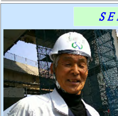
笑顔が素敵なダンディSさん