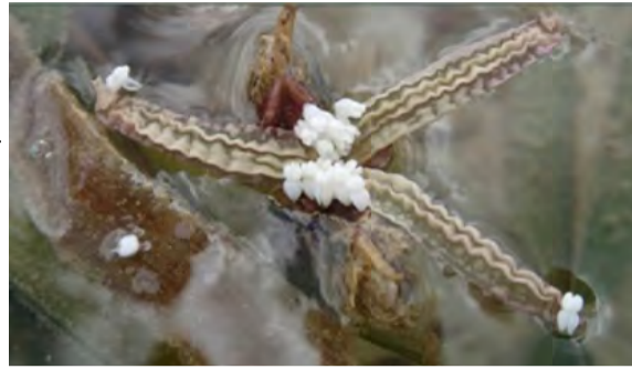
ウミシヨウブの花

環境でしたが、2010年代後半から西表島でウミシヨウブの減少が確認され始めます。群生地は消滅の危機に瀕しました。その原因は、保護活動により増加した、 絶滅危惧種のアオウミガメによる捕食 です。そこで動いたのが、環境教育の一環でウミシヨウブの観察を行っていたNPO法人企業と石垣市の小学校の児童たちです。