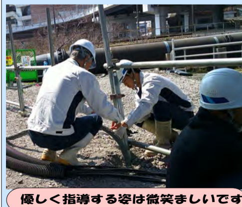
優しく指導する姿は微笑ましいです