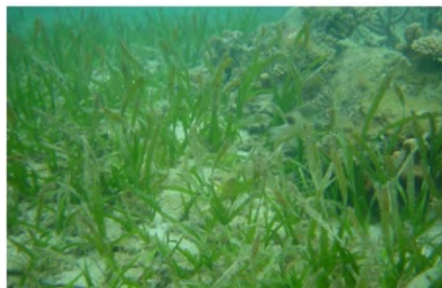
青々としていたウミシヨウブ 2005年撮影

もつしばらへすると、各地で新緑がまぶしい季節を迎えます。毎年、5月4日のみどりの日は皆さんだ4月15日～5月14日は、自然に親しみ、その理解と関心を深める「みどりの月間」です。1年のうちで特に緑の美しさを感じられるこの季節、みどりの日や緑の月間をきっかけに、自然に感謝し、環境保護、生物多様性の大切さにあらためて目を向けてみませんか？