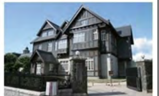
▲旧門司三井倶楽部